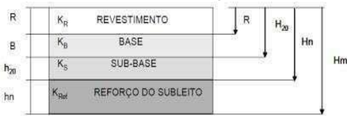
Figura 03. Dimensionamento de pavimento flexível